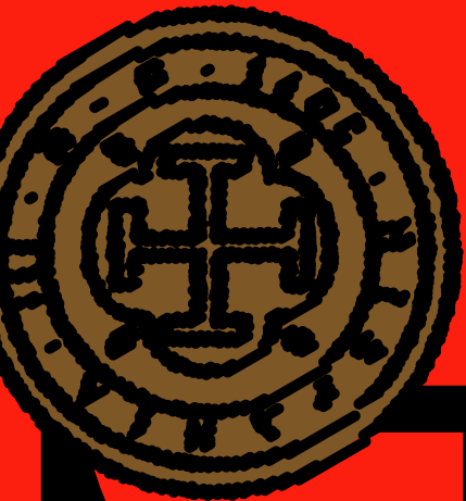
Premis Literaris Lleida 2023