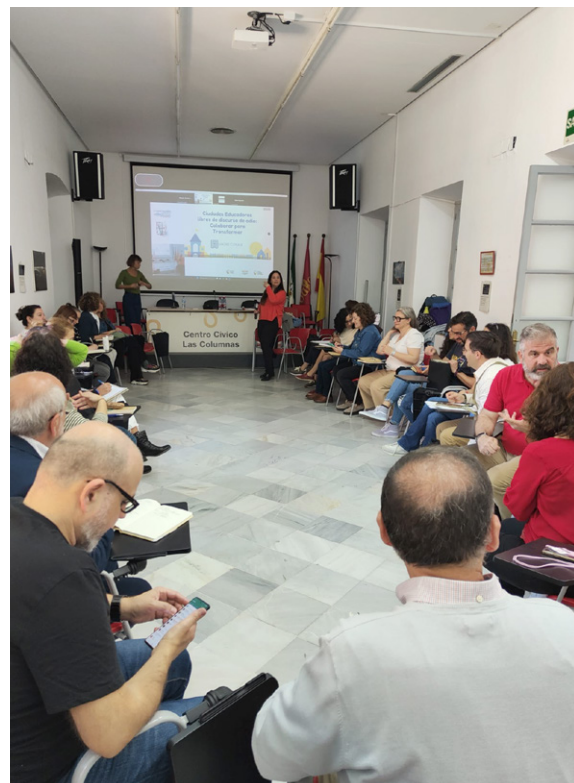
Dinámica de Trabajo con la Asociación Madre Coraje