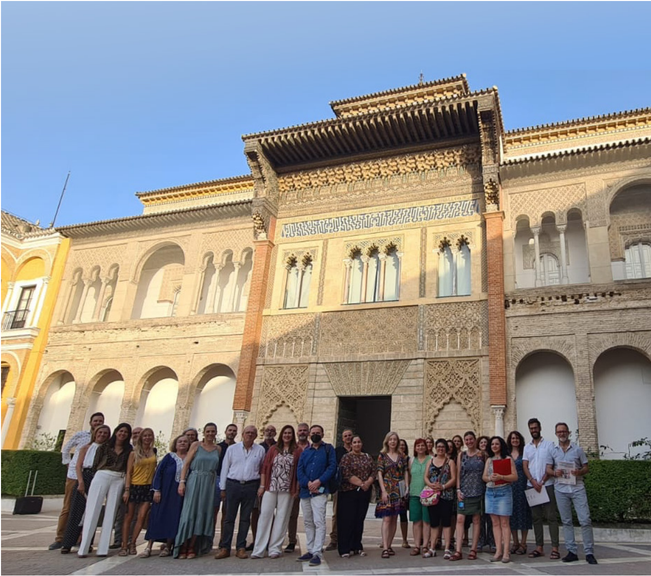
Ciudades participantes en el primer Encuentro de la Red “La Ciudad Educadora frente a la Cultura del Odio”

La participación por parte de las ciudades ha sido mayoritariamente activa, cumpliendo con sus deberes en el plazo establecido.