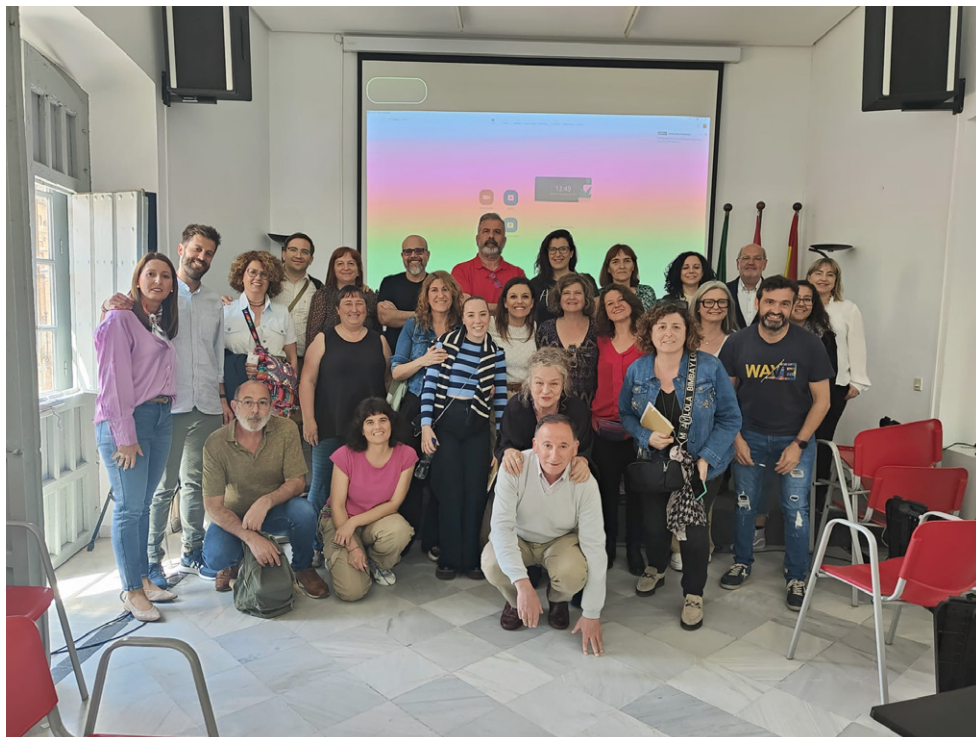
Asistentes al Tercer Encuentro de la Red