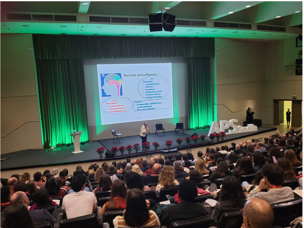
Encuentro Nacional APS