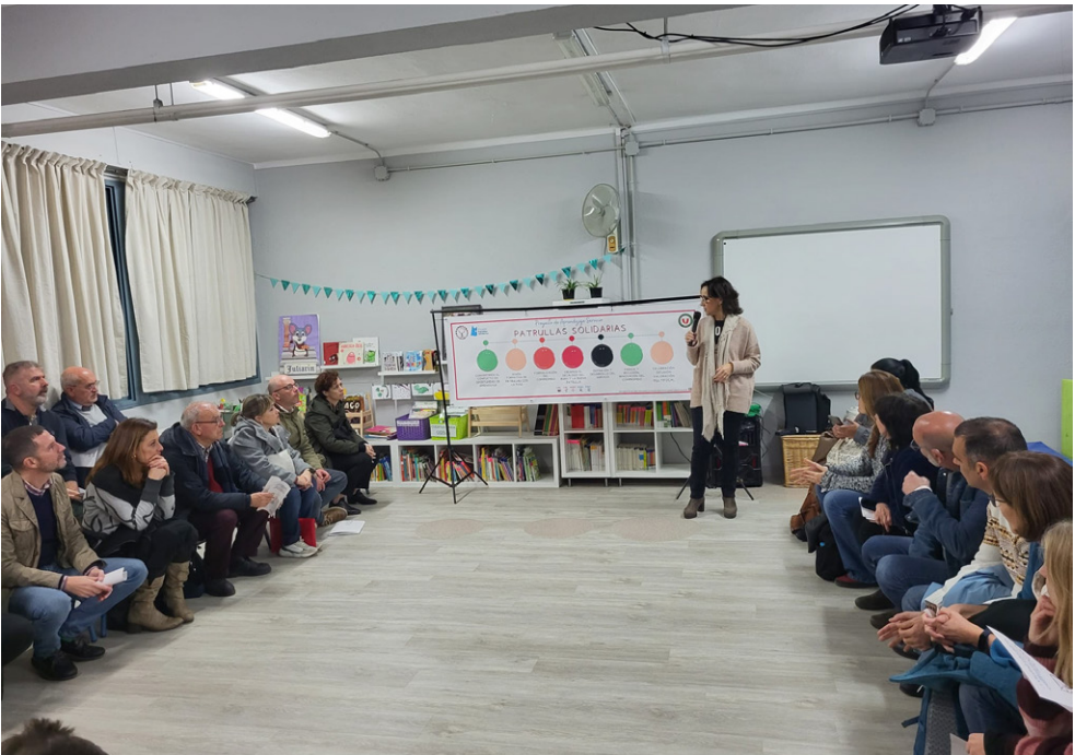
Visita a la Escuela de Educación Infantil “Julio César” gestionado mediante metodología APS. Encuentro Nacional APS